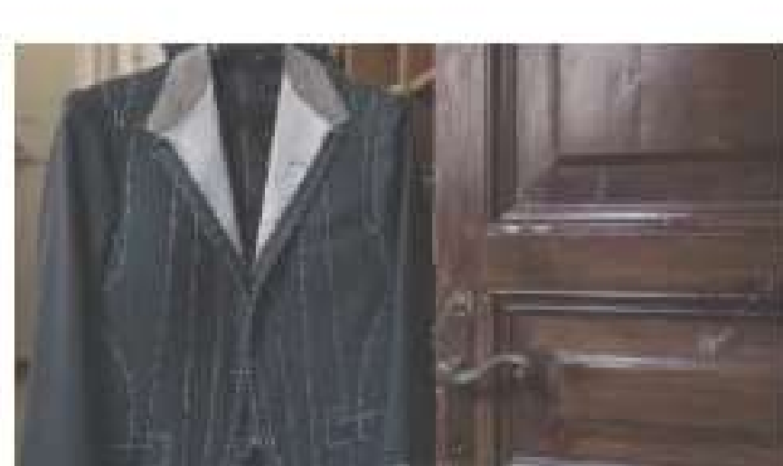
Appunti di stile: la Giacca Romana