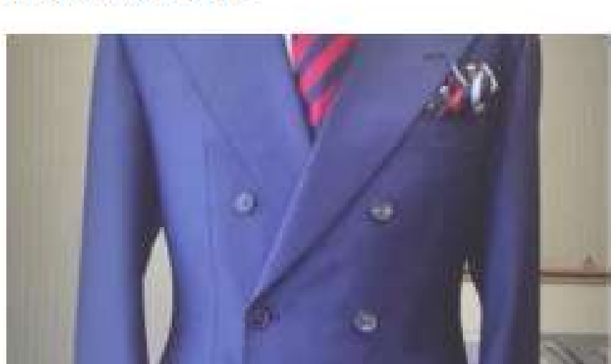
EdG introduces Sartoria Crimi