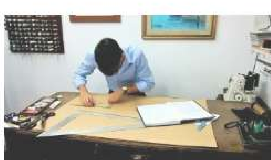
EdG introduces Sartoria Tofani